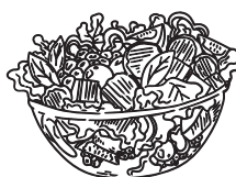
Side salad 4